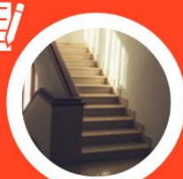
Vaste trap plaatsen