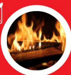
Open haard of houtkachel