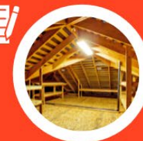
Zolder tot kamer ombouwen